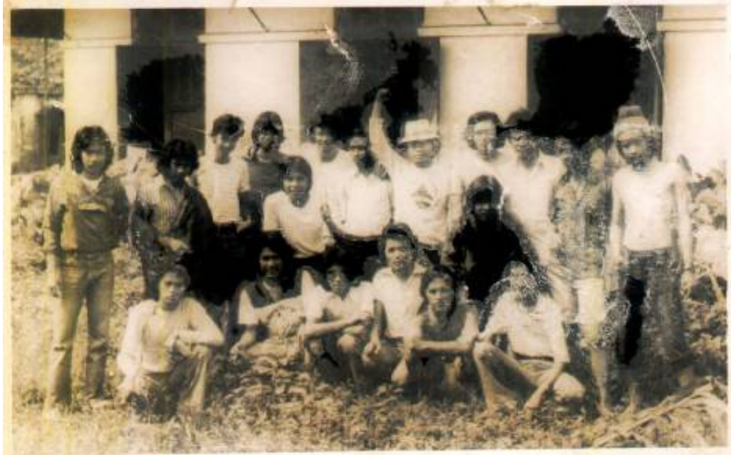
Penjara Tahanan Politik Cimahi 1978

dari jurusan Elektro, ketika melakukan serangan fajar mengendarai vespa tertangkap polisi tibus (ketertiban umum) kemudian dimasukkan ke kendaraan truk terbuka dan ditahan sementara di kantor kodim baru di sore harinya kami dibawa ke penjara tahanan politik Cimahi diinapkan di sana selama 35 hari. Kami bertemu dengan rekan-rekan mahasiswa ITB lainnya yang mereka juga tertangkap sedang melakukan serangan fajar di tempat lain.